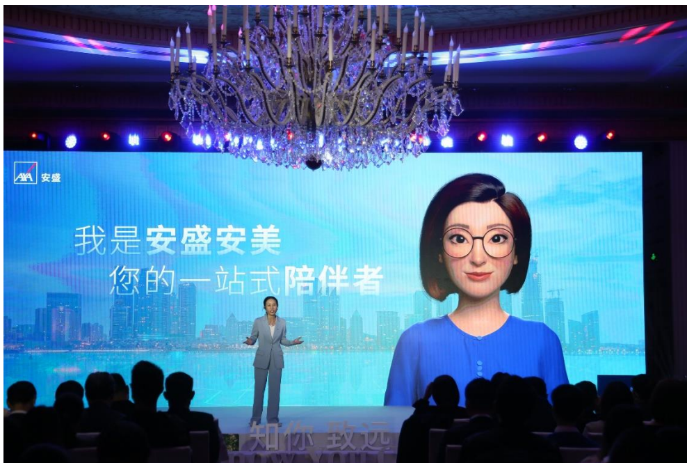
安盛健康解决方案

秉持“以客户为中心”的经营理念，安盛天平深入洞察客户需求，不断延伸品牌能力边界，拓展保险“产品+服务”的广度和深度，发展出涵盖各类场景的家庭保障解决方案，满足不同家庭成员在人生不同阶段的保障需求，包括今年推出的提供涵盖住院、门诊、海外医疗在内的全面保障计划的盛世臻选医疗保险，提供“一站式”医疗支持的盛世守护珍爱版健康保险，以及数字化服务平台“安盛安美”，帮助用户轻松管理全家人的身心健康。